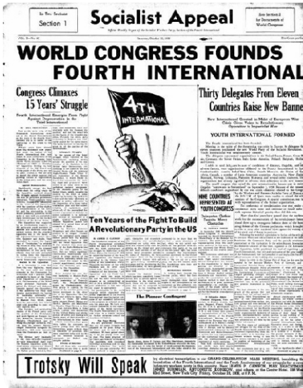
Publicación "Socialist Appeal" "Congreso Mundial Funda la Cuarta Internacional"

Al comenzar la Guerra en 1939, la sede del Secretariado General fue trasladada a Nueva York, para ese momento el partido trotskista más importante era el norteamericano Socialist Workers Party (SWP o Partido Socialista de los Trabajadores), que conocerá una escisión en 1940 a partir de las discrepancias entre Max Schachtman y James Burnham, por un lado, y por el otro, las posiciones defendidas por Trotsky y James Cannon.